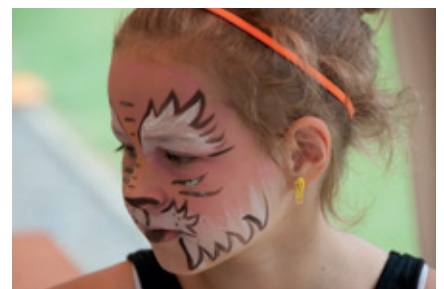
Auch ein Rahmenprogramm wurde geboten