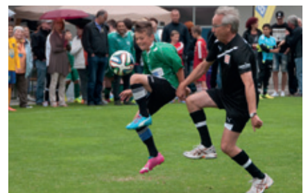
... auch der Bürgermeister bewies seine Kampfkraft.